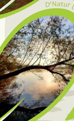
D'Natur bei Sonnenopgang