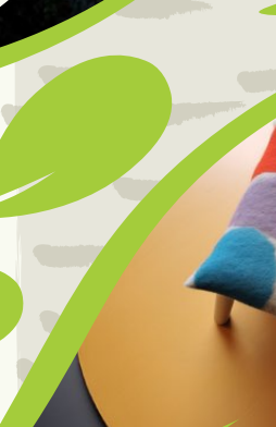
Filze fir doheem